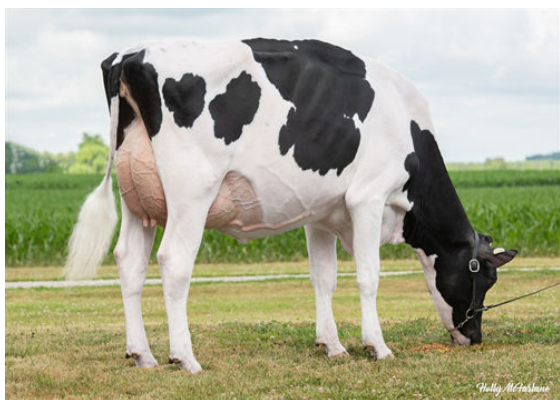
HOWARD-VIEW CRSBUL DISCODANCER