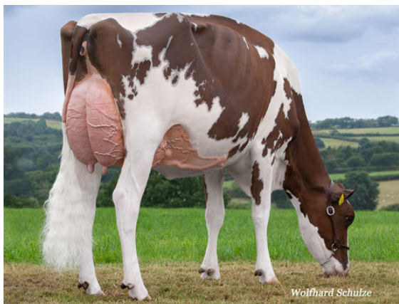
PANDA PURE GOLD RED